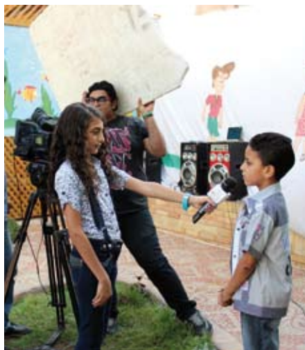
Tutaj jesteśmy w domu – wywiad w Sat7, chrześcijańskiej telewizji dla Bliskiego Wschodu.

Odnawianie oblicza ziemi – taki jest właśnie cel głoszenia Dobrej Nowiny za pomocą słów i obrazów. Duch musi się posługiwać również środkami nowoczesnej techniki. Na Ukrainie działa On poprzez EWTN („Sieć Telewizyjną Wiecznego Słowa”). Wsparliśmy wprowadzenie tej największej na świecie katolickiej stacji telewizyjnej do sieci kablowych. Niebawem rozpocznie on