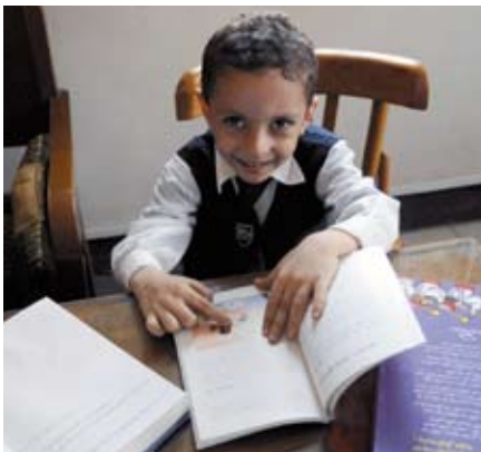
Dobra Nowina w ilustracjach – w Egipcie Biblię poznają już najmłodszy.

Są to te same litery, które poruszyły serca wielu późniejszych świętych i umożliwiły Bogu odnawianie za ich pośrednictwem oblicza ziemi. Najbardziej znanym przykładem oddziaływania Słowa jest historia świętego Augustyna. Dzięki lekturze Słowa nawrócili się niezliczeni ludzie. Materialny fundament działania Ducha tworzy Biblia – Księga Ksiąg. W zeszłym roku PKWP wspierała finansowo wydane przez inne instytucje