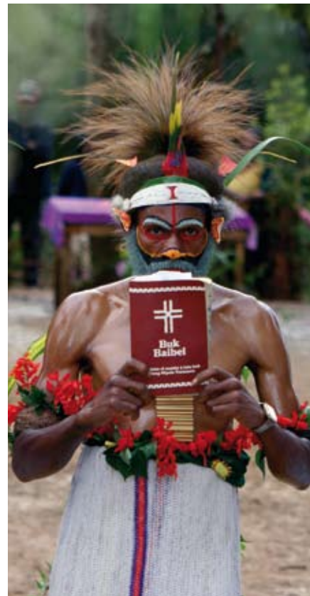
Duch Chrystusa wieje, kędy chce – Zesłanie Ducha Świętego w Mendi (Papua-Nowa Gwinea).

nadawanie za pośrednictwem satelity, aby Słowo mogło docierać również do regionów wiejskich (96 000 zł). W kraju, któremu grozi powrót do dyktatury, katolickie stacje radiowe i telewizyjne są prawdziwymi oknami wolności. •