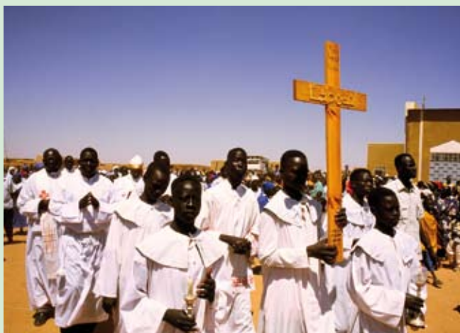
Życie w znaku krzyża – liturgia Wielkiego Piątku w Chartumie (Sudan).

„Krzyż nie jest przekleństwem, lecz błogosławieństwem. Jest on jednym z fundamentów chrześcijaństwa. Każdy z nas ma niejako na nowo przeżywać to, czego doświadczył w swoim ziemskim życiu Chrystus. Z tego właśnie powodu naszym zadaniem jest nie tylko głoszenie Jego Dobrej Nowiny i urzeczywistnianie Jego miłości do ludzi, lecz przede wszystkim udział w Jego ofierze krzyża, którą Pan składać będzie aż do końca czasów”.