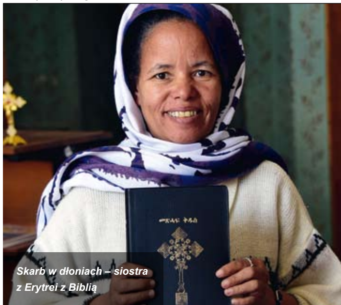
Skarb w dłoniach – siostra z Erytrei z Biblią

„Ktoś powiedział: co by się stało, gdybyśmy traktowali Biblię tak jak traktujemy nasze telefony komórkowe? Gdybyśmy otwierali ją wielokrotnie w ciągu dnia, gdybyśmy czytali wiadomości Boga zawarte w Biblii, tak jak czytamy wiadomości z komórki?”