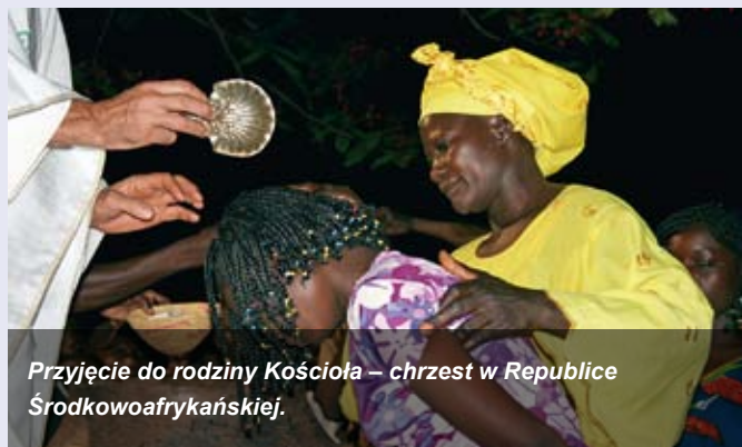
Przyjęcie do rodziny Kościoła – chrzest w Republice Środkowoafrykańskiej.

Według papieża Franciszka rodzina jest „arcydziełem Boga”, głęboko zapisanym w naturze człowieka. Potrzebni są jednak pomocnicy, którzy będą pielęgnować ten Boży skarb. W każdym kraju ich postęga wygląda inaczej. Oto dwa przykłady.