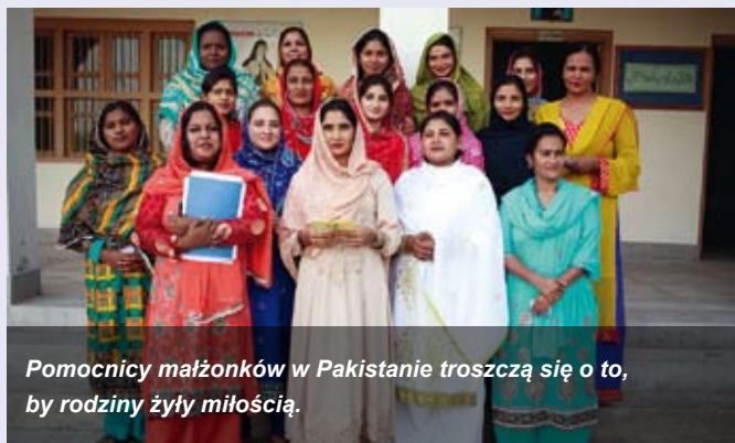
Pomocnicy małżonków w Pakistanie troszczą się o to, by rodziny żyły miłością.