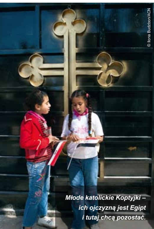
Młode katolickie Koptyjki – ich ojczyzną jest Egipt i tutaj chcą pozostać.

na rękę. Wyznawcy Chrystusa wiedzą, że częścią Ewangelii jest męka. Patriarchat koptyjskokatolicki zamierza wyjaśnić wiernym sens cierpienia, aby łatwiej mogli je znosić. Wzorem jest Chrystus, którego cierpienie prowadzi do życia. Patriarchat poprosił nas o pomoc w wydaniu 5000 egzemplarzy modlitewnika poświęconemu Drodze Krzyżowej (15 800 zł), który ma być rozdawany w kościołach. Wszyscy chcą się modlić. Dla tych ludzi to modlitwa o życie, o przeżycie Chrystusowego Ciała – Kościoła nad Nilem. •