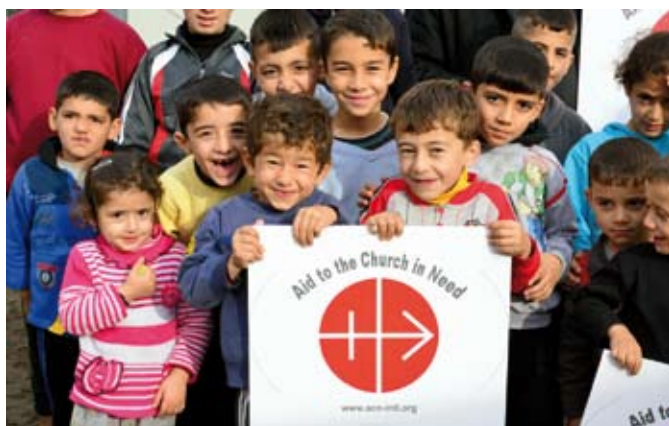
Ocalenie i radość z nowego życia – dzieci uchodźców z Iraku w szkole, której budowę sfinansowali Państwo.

W roku 2014 dramat chrześcijan na Bliskim i Środkowym Wschodzie znalazł się w centrum uwagi światowej opinii publicznej. Syrię i Irak musiały opuścić setki tysięcy wierzących w Chrystusa. Koszty działań związanych z pomocą dla uchodźców wzrosły o 5% i wyniosły w roku 2014 ponad 13% budżetu ogółem. Udział tego typu działań wzrósł również dla Azji (18,7%). Podjęto je tutaj głównie w związku z sytuacją na Filipinach, które nawiedził tajfun Haiyan – jeden z najsilniejszych w historii. Poza Filipinami w regionie tym można się spotkać również z formami dyskryminacji religijnej czy wręcz prześladowania chrześcijan. W roku 2014 największym beneficjentem naszej pomocy była ponownie Afryka . Stamtąd pochodziło najwięcej, bo ponad jedna trzecia, tj. 2648 wniosków; tam też trafia najwięcej stypendiów mszalnych – otrzymuje je 10 694 księży. Wśród krajów, do których często kierujemy pomoc, są również wciąż jeszcze niektóre kraje Europy Wschodniej , zwłaszcza Ukraina. Pomagamy tutaj każdemu klerykowi. Największym kontynentem katolickim pozostaje Ameryka Łacińska . Powstaje tam wiele wspólnot katolickich, ale nasila się również działalność rozmaitych sekt i handlarzy narkotyków. Z tego powodu obszarem wymagającym szczególnie dużych inwestycji jest katecheza.